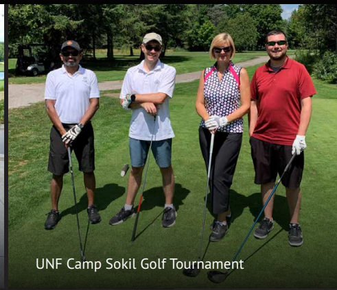
UNF Camp Sokil Golf Tournament