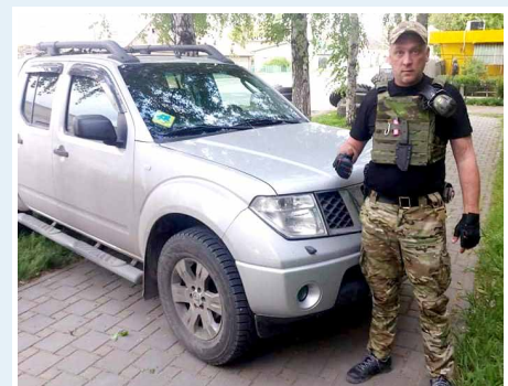
Vehicle delivered to Zaporizhzhia