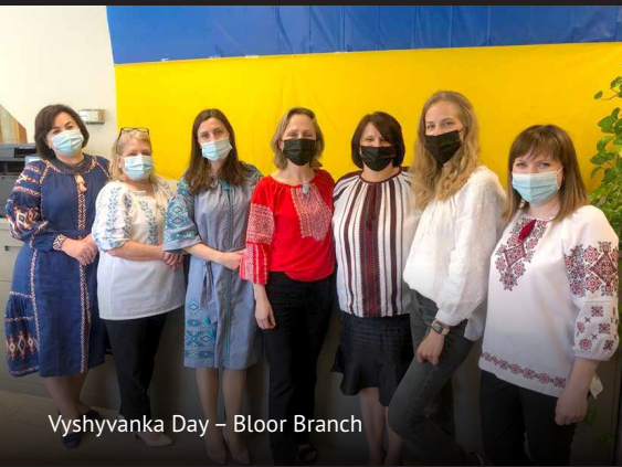
Vyshyvanka Day – Bloor Branch