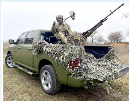
Vehicle delivered to Odesa