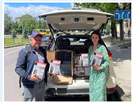
150 walkie-talkies delivered to Odesa