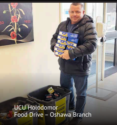
UCU Holodomor Food Drive – Oshawa Branch