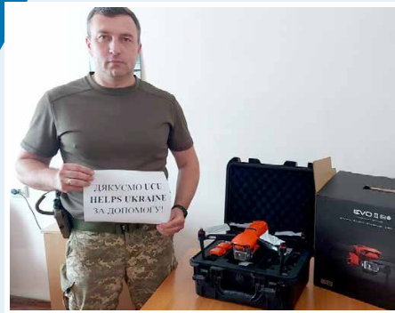
Drone delivered to Military Naval Forces (Armed Forces of Ukraine)