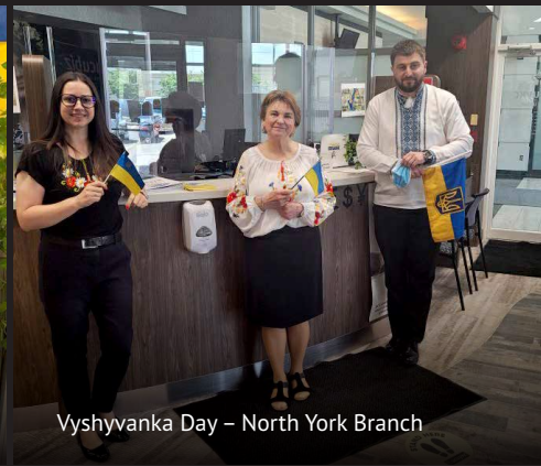
Vyshyvanka Day – North York Branch