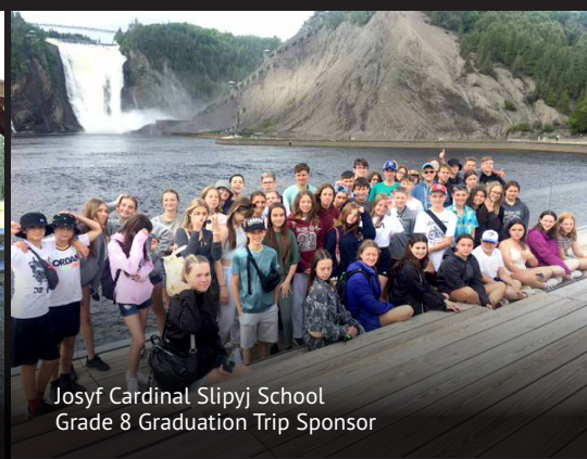
Josyf Cardinal Slipyj School Grade 8 Graduation Trip Sponsor