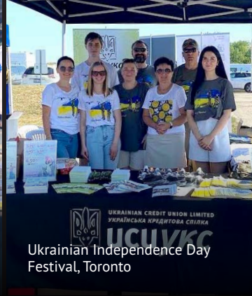
Ukrainian Independence Day Festival, Toronto