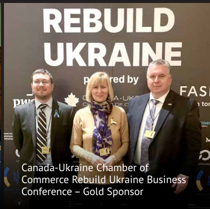
Canada-Ukraine Chamber of Commerce Rebuild Ukraine Business Conference – Gold Sponsor