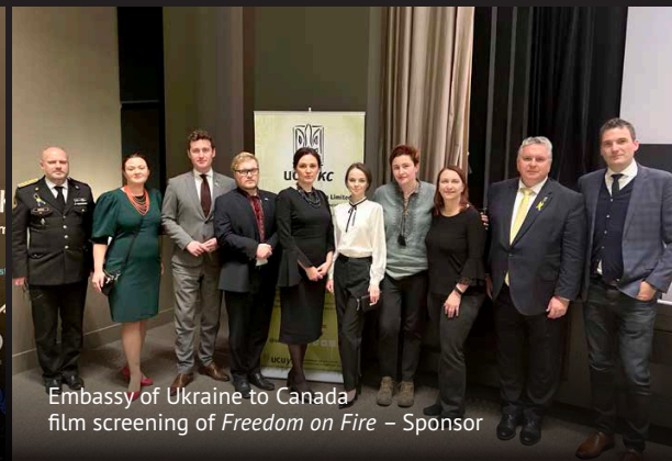
Embassy of Ukraine to Canada film screening of Freedom on Fire – Sponsor