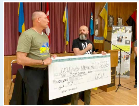
Accepted $10,000 donation from UCU for three vehicles to be sent to Luhansk