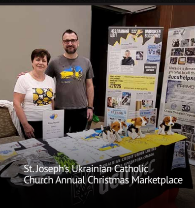
St. Joseph's Ukrainian Catholic Church Annual Christmas Marketplace