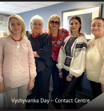
Vyshyvanka Day – Contact Centre