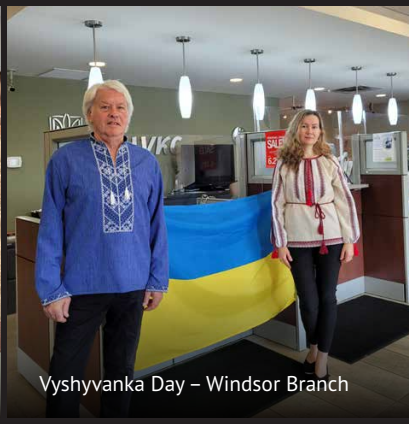
Vyshyvanka Day – Windsor Branch