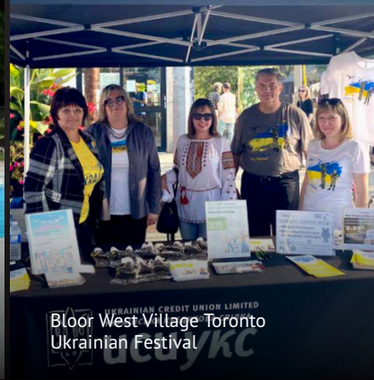
Bloor West Village Toronto Ukrainian Festival