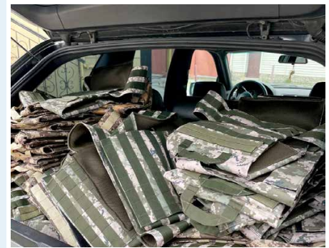
Bulletproof vests delivered to Luhansk