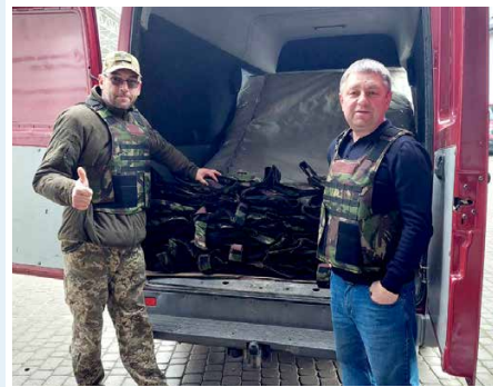
Bulletproof vests delivered to Mykolaiv