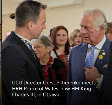
UCU Director Orest Sklierenko meets HRH Prince of Wales, now HM King Charles III, in Ottawa