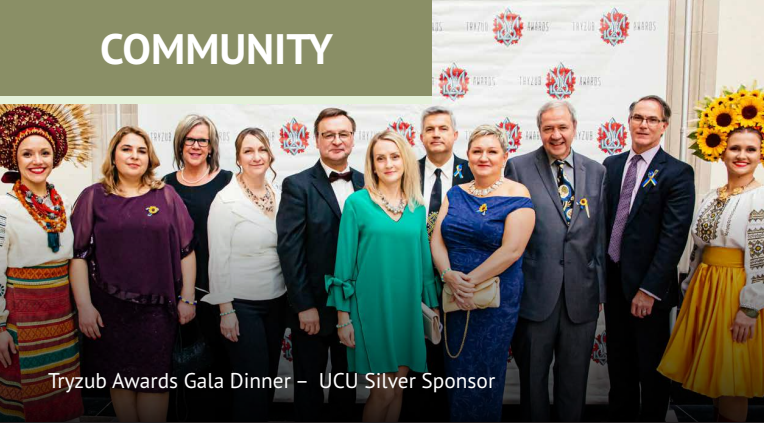
Tryzub Awards Gala Dinner – UCU Silver Sponsor