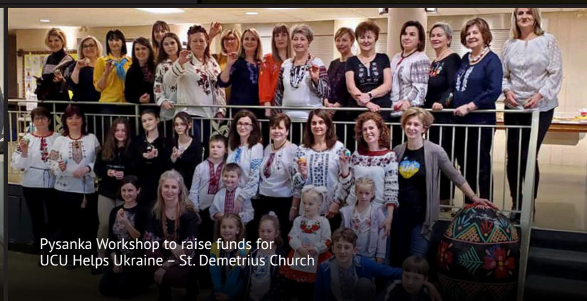
Pysanka Workshop to raise funds for UCU Helps Ukraine – St. Demetrius Church