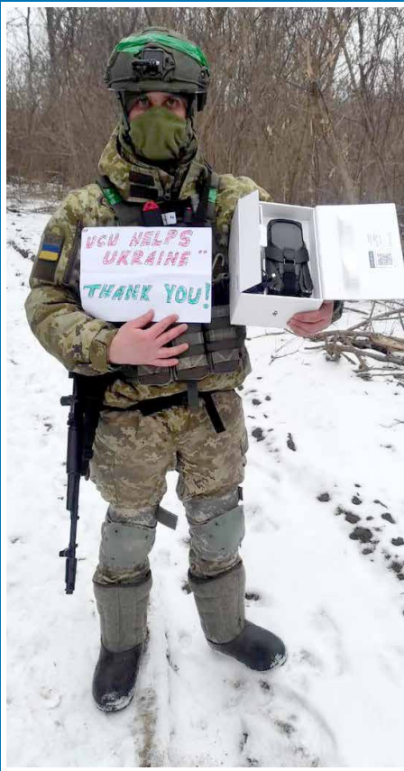
Drone delivered to Kharkiv