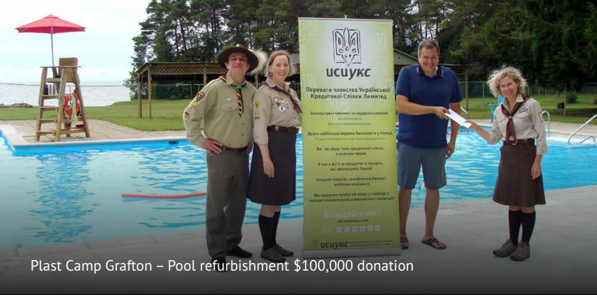
Plast Camp Grafton – Pool refurbishment $100,000 donation