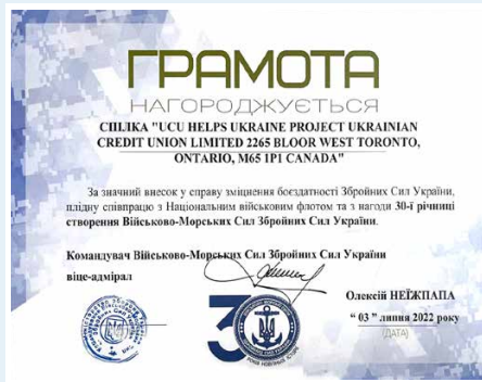
From the Commander of the Military Naval Forces (Armed Forces of Ukraine)