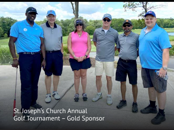
St. Joseph's Church Annual Golf Tournament – Gold Sponsor