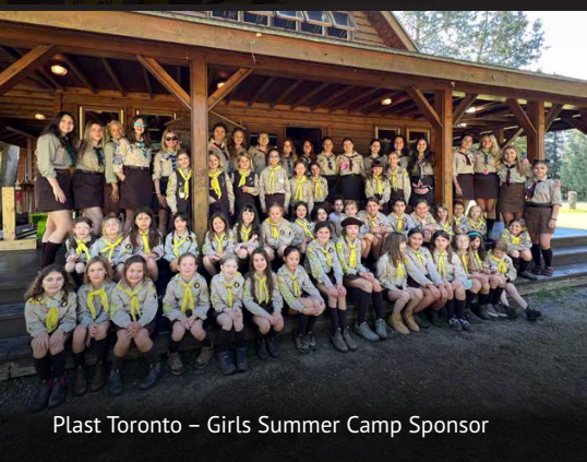
Plast Toronto – Girls Summer Camp Sponsor