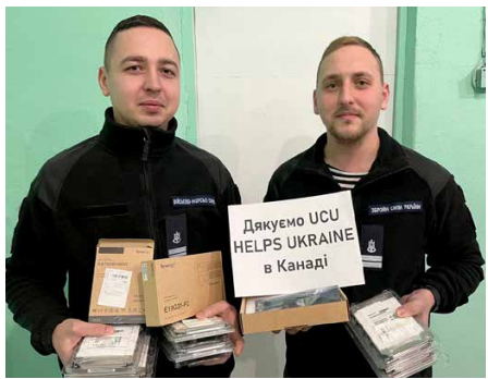
Computer servers delivered to Military Naval Forces (Armed Forces of Ukraine)