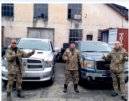
Two vehicles delivered to Odesa