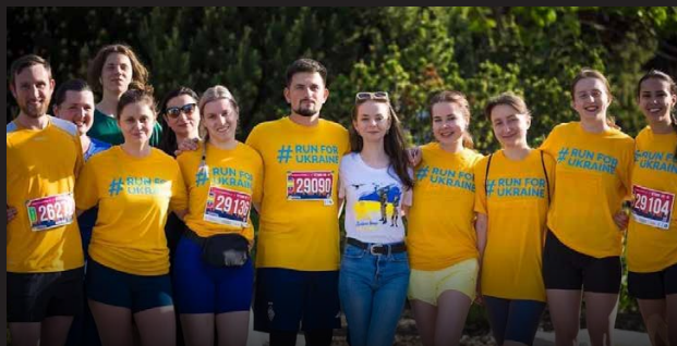
Canada-Ukraine Parliamentary Program, Ottawa