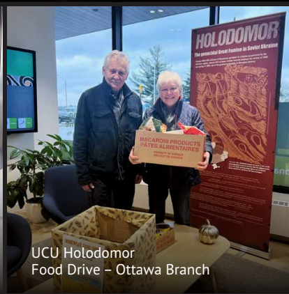
UCU Holodomor Food Drive – Ottawa Branch