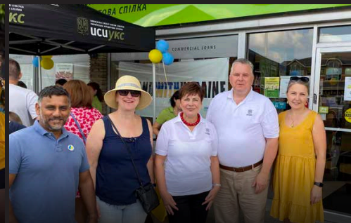
UCU Member Appreciation BBQ – Mississauga Branch