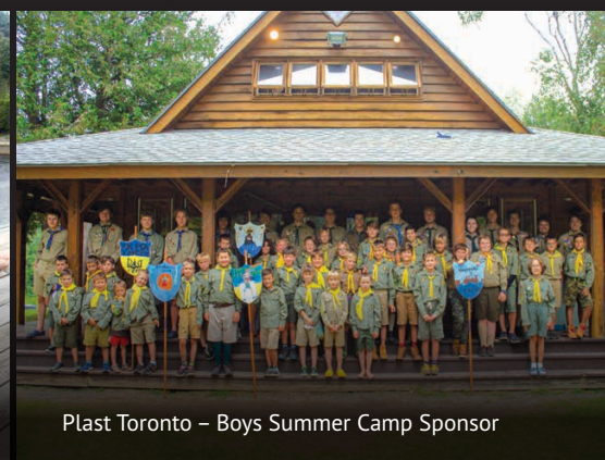
Plast Toronto – Boys Summer Camp Sponsor