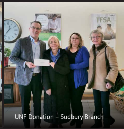
UNF Donation – Sudbury Branch