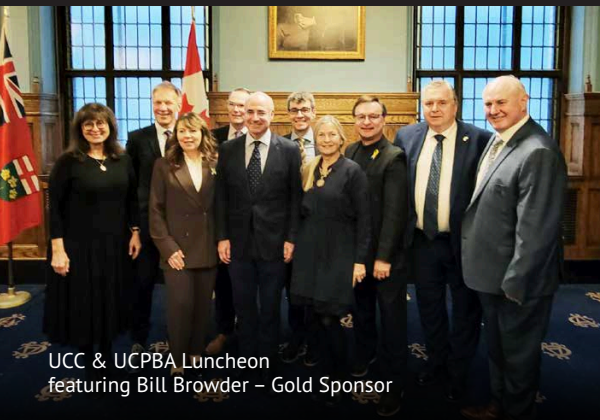
UCC & UCPBA Luncheon featuring Bill Browder – Gold Sponsor