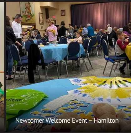
Newcomer Welcome Event – Hamilton