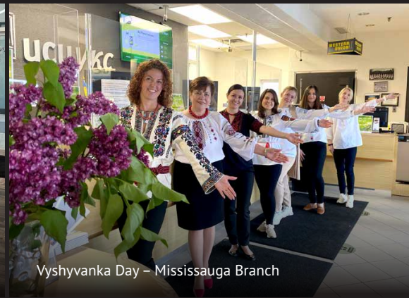
Vyshyvanka Day – Mississauga Branch